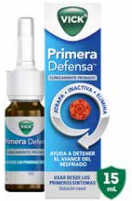
VICK PRIMERA DEFENSA 15 mL