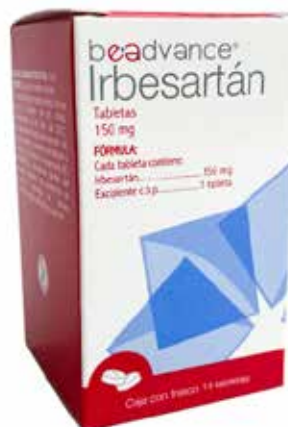
IRBESARTÁN 150 mg 14 tabletas