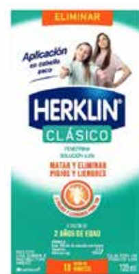
SHAMPOO HERKLIN 120 mL