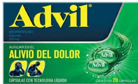
ADVIL 200 MG 20 tabletas