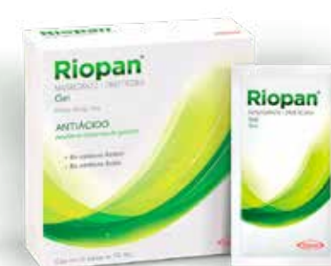
RIOPAN 20 sobres de 10 mL