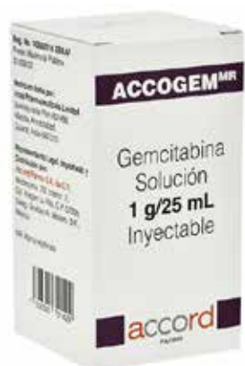
ACCOGEM Gemcitabina Solución Inyectable 1 g / 25 mL