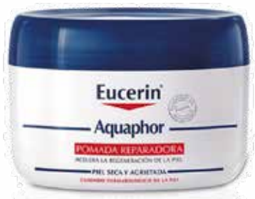
EUCERIN AQUAPHOR Pomada reparadora