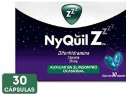
NYQUIL Z 30 cápsulas