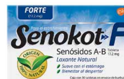
SEKOKOT F Senósidos A-B 30 tabletas