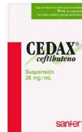
CEDAX Ceftibuteno Suspensión 36 mg/mL