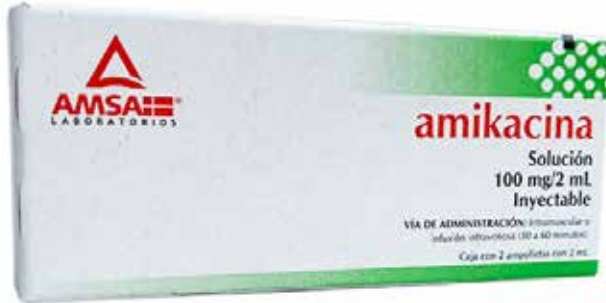
AMIKACINA Solución Inyectable Caja 2 ampollas con 2 ml