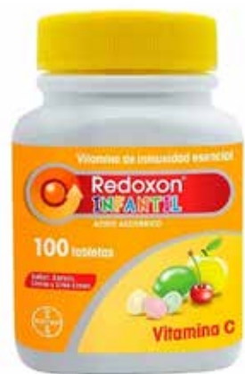
REDOXON INFANTIL 100 tabletas