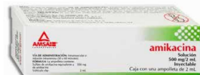
AMIKACINA 500 mg/ 2mL