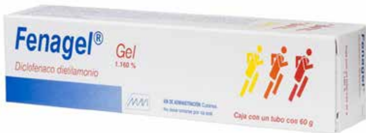
FENAGEL GEL Diclofenaco dietilamonio 60 g