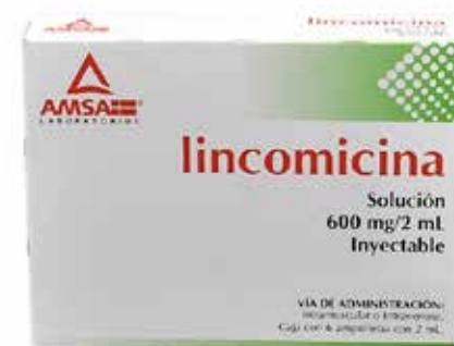
LINCOMICINA Solución Inyectable 600 mg/2mL 6 ampolleta con 2 mL