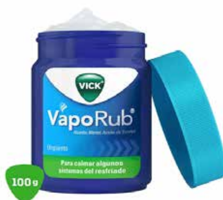
VICK VAPORUB 100 g