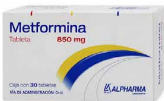
METFORMINA 850 mg 30 tabletas