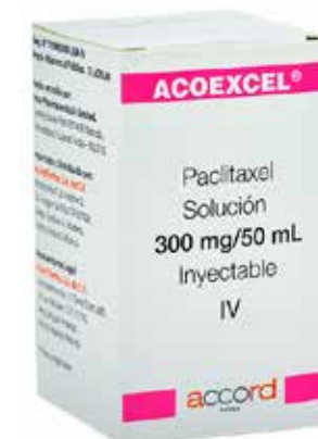
ACOEXCEL Paclitaxel Solución Inyectable 300 mg/50 mL