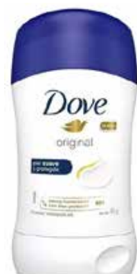
DOVE BARRA ANTITRANSPIRANTE 45 g