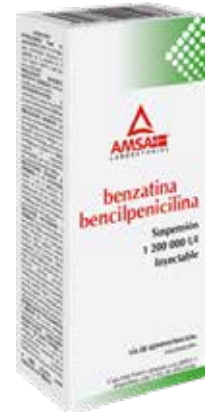
BENZATINA BENCILPENICILINA Suspensión Inyectable 1,200,000 UI