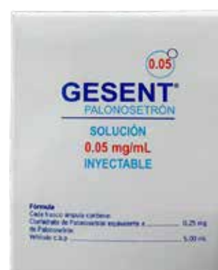
GESENT Palonosetrón Solución Inyectable 0.05 mg/mL