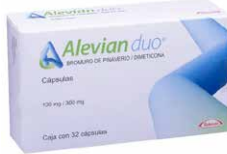
ALEVIAN DUO 100 mg/300 mg 32 tabletas