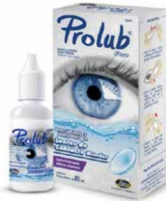
PROLUB 10 mL