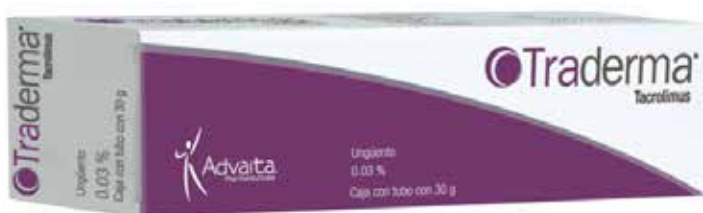
TRADERMA Tacrolimus unguento 0.03% 30 g