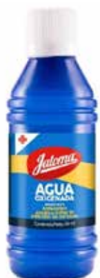
AGUA OXIGENADA 112 mL