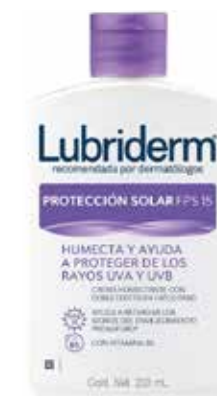
LUBRIDERM FPS 15 200 mL