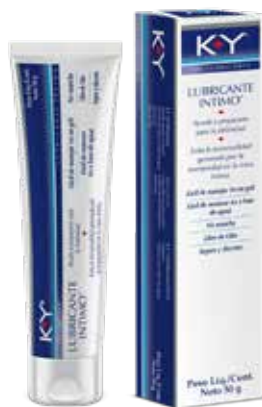
KY GEL LUBRICANTE 50 g