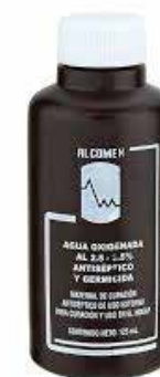
AGUA OXIGENADA 125 mL