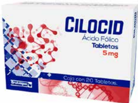
CILOCID Ácido Fólico 5 mg 20 tabletas