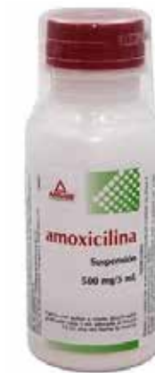
AMOXICILINA Suspensión 500 mg / 5 mL