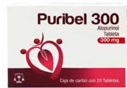
PURIBEL 300 Alopurinol 300 mg 20 tabletas