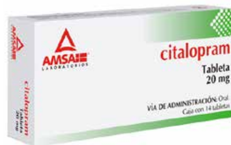
CITALOPRAM 20 mg 14 tabletas