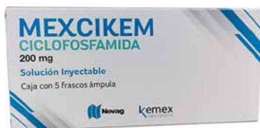
MEXCIKEM Ciclofosfamida. Solución Inyectable 200 mg 5 frascos ampula