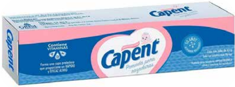
CAPENT 45 g