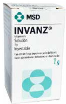
INVANZ Ertapenem 1g