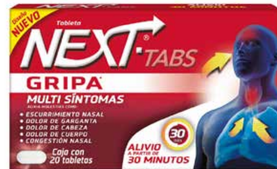
NEXT TABS 20 tabletas