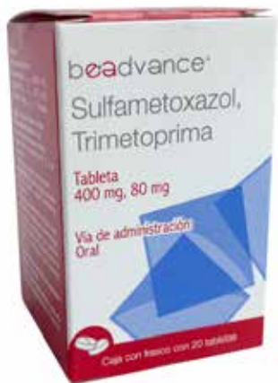
SULFAMETOXAZOL, TRIMETOPRIMA 20 tabletas