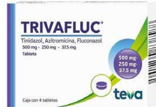
TRIVAFLUC 4 tabletas