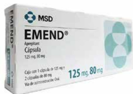
EMEND Aprepitant 125 mg, 80 mg