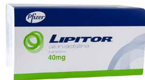
LIPITOR Atorvastatina 40 mg