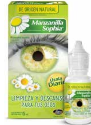
MANZANILLA SOPHIA 15 mL