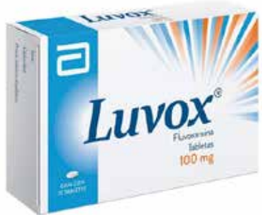
LUVOX 100 mg 15 tabletas