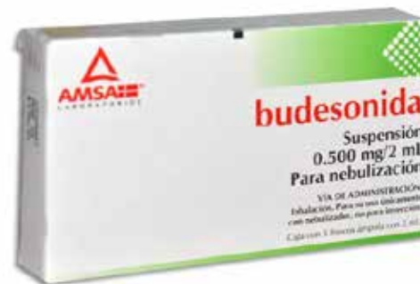
BUDESONIDA 0.500 mg/ 2 mL