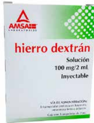
HIERRO DEXTRÁN Solución Inyectable 100 mg/2 mL 3 ampolletas 2 mL