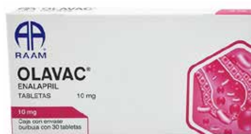
OLAVAC Enalapril 10 mg 30 tabletas