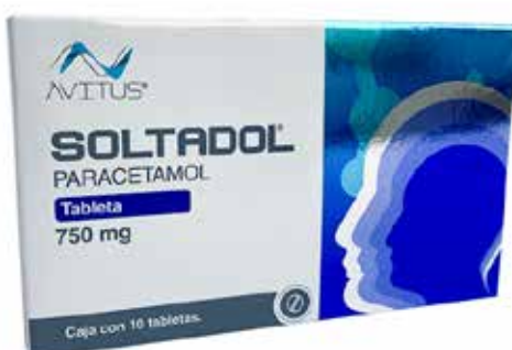
SOLTADOL Paracetamol 750 mg 10 tabletas